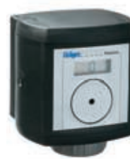
Dräger Polytron 3000

Sensortyp und Messbereich sind beim Dräger Polytron 3000 voreingestellt. Er wurde für die einfache Ein-Mann-Kalibrierung entwickelt. Der Sensor wird im Dräger Polytron 3000 kalibriert, es können aber auch vorkalibrierte Sensoren nach dem plug-and-play-Prinzip in den Transmitter eingesetzt werden.