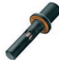
Nachfüllbarer DrägerSensor: für die Messung saurer Gase.