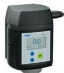
Dräger Polytron 7000: mit integriertem Pumpenmodul.*