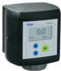
Dräger Polytron 7000